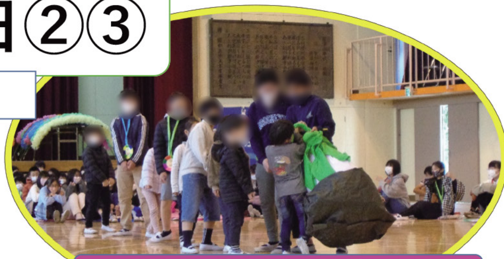
演劇風コント：大きなカブ