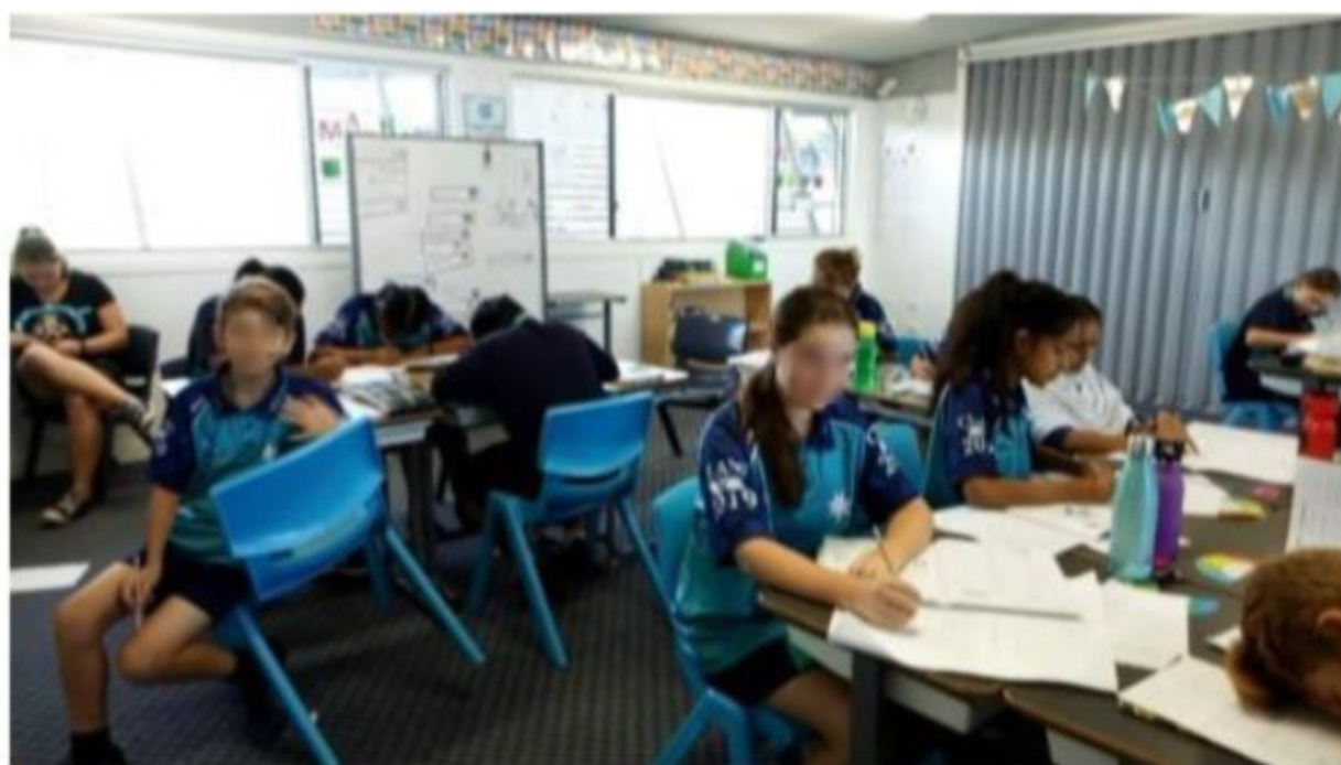
Classroom at SLSS