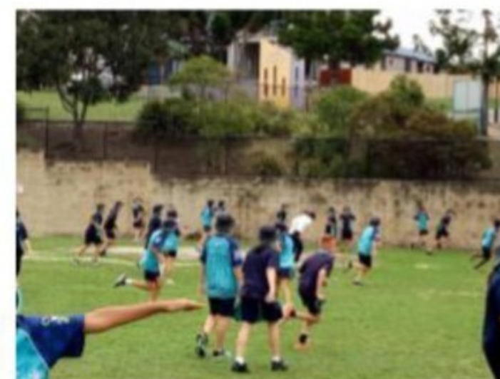
Playing at the schoolyard at the recess.